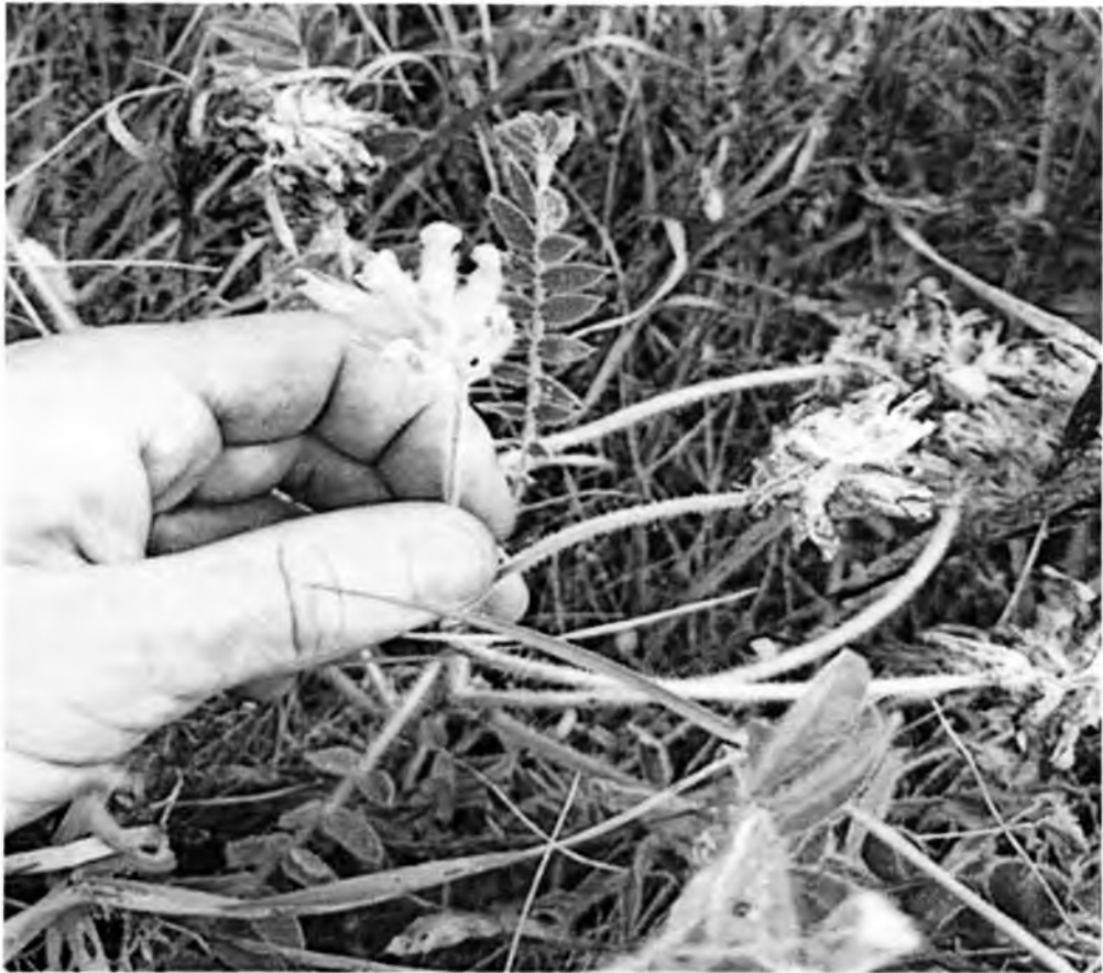
Фото 2. Астрагал шерстистоквітковий ( Astragalus dasyanthus ) у межах охоронної зони