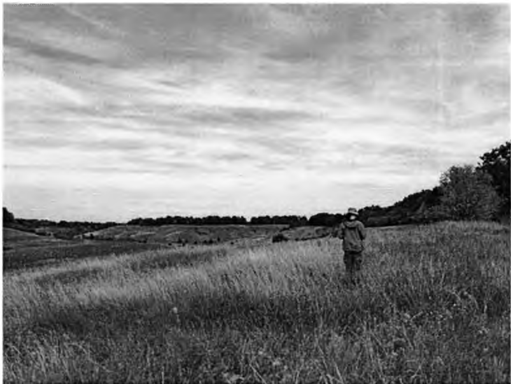
Фото 3. Загальний вигляд ландшафтів охоронної зони