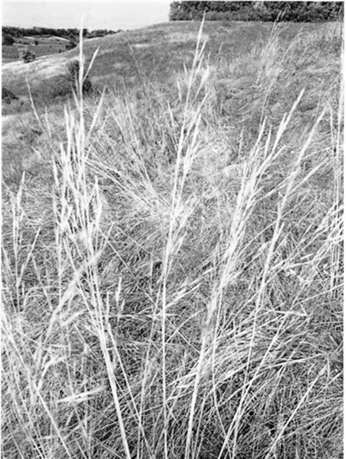
Фото 1. Ковила волосиста ( Stipa capillata ) у межах охоронної зони